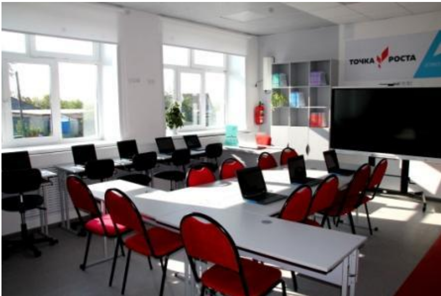
Помещение для проектной деятельности