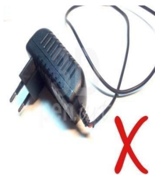
Поврежденный блок питания для 3D ручки

При работе с любым нагревательным или электрическим просто необходимо соблюдать технику безопасности. От соблюдения всех норм зависит как сохранность оборудования, так и твое личное здоровье. 3D ручка не является исключением, так как это электрический прибор с нагревающимся элементом. В этой статье мы разберем все меры предосторожности при работе с 3D ручкой